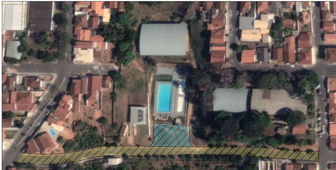
PLANTA DE SITUAÇÃO